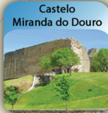
Castelo Miranda do Douro