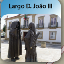
Largo D. João III