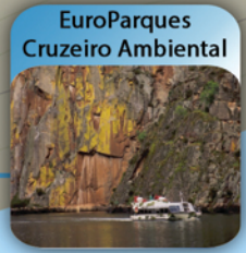
EuroParques Cruzeiro Ambiental