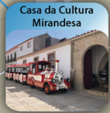
Casa da Cultura Mirandesa