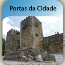
Portas da Cidade