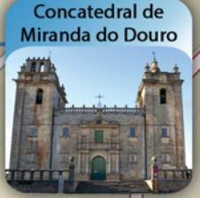
Concatedral de Miranda do Douro