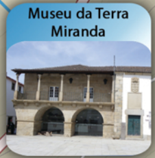
Museu da Terra Miranda