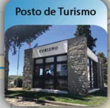
Posto de Turismo