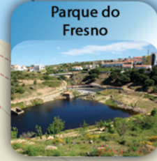
Parque do Fresno