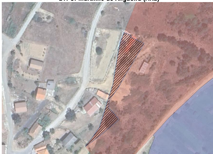
E1: S. Martinho de Angueira (ARE)

E2: Palaçoulo (AMI) (o curso de água que cruza esta parcela, representado na carta da REN por linha, não é abrangido pela exclusão)